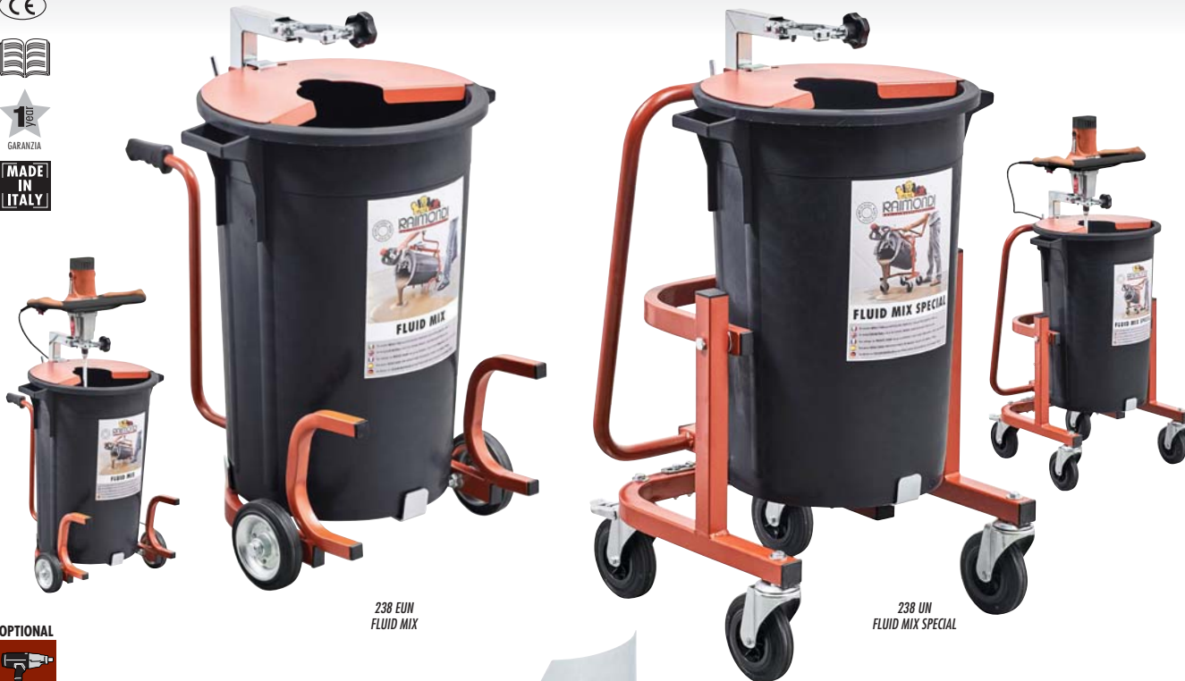
238 EUN FLUID MIX