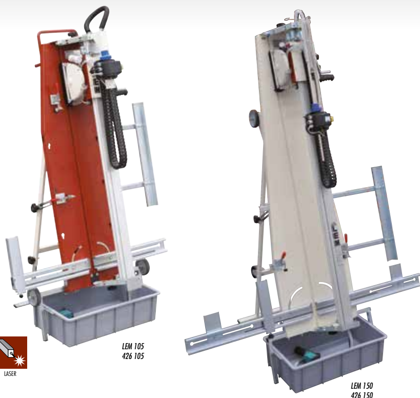
LEM 105 426 105