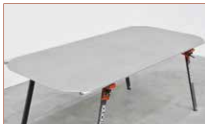
■ LASTRA INIZIALE ■ MOTOKOMPASS ■ LASTRA FINALE