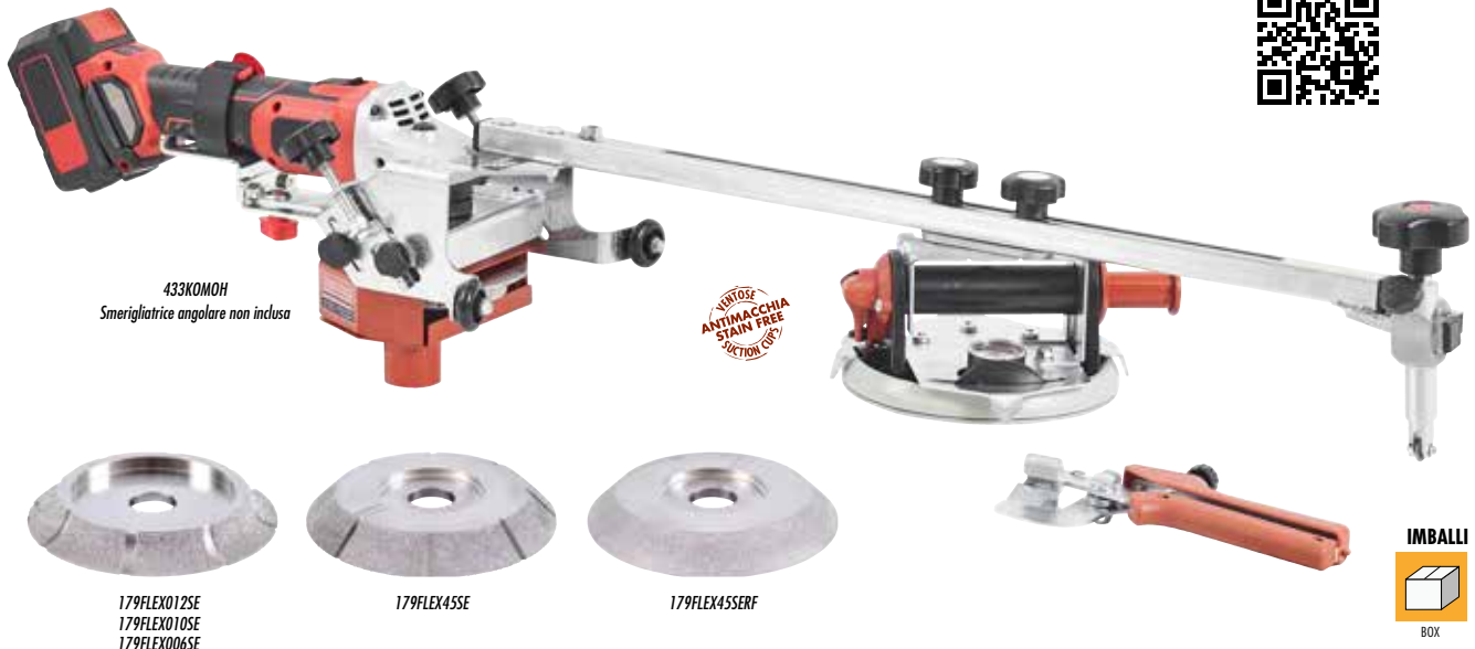
433KOMOH Smerigliatrice angolare non inclusa