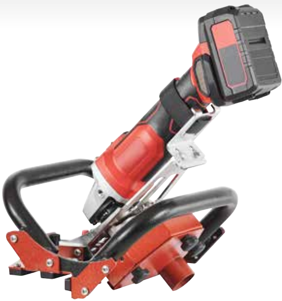
433BCOH Smerigliatrice angolare non inclusa