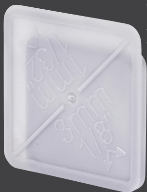
Vista posteriore (facciata piatta) Rear view (flat facet) Vue arrière (côté plat) Vista trasera (cara plana)

🇮🇹 Distanziatore rimovibile e riutilizzabile a doppia misura (fuga) 🇺🇸 Removable and reusable dual size (joint) spacer 🇫🇷 Croisillon double (joint) récupérable et réutilisable 🇪🇸 Separador recuperable con doble ancho (para juntas)