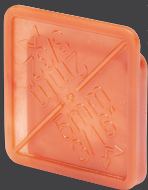
Vista posteriore (facciata piatta) Rear view (flat facet) Vue arrière (côté plat) Vista trasera (cara plana)