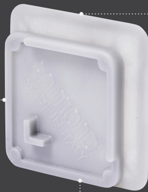
Vista frontale Front view Vue face Vista frontal

Un unico distanziatore, due misure (1 e 3 mm) One spacer, two joint sizes (1 & 3 mm | 1/32" & 1/8") Un croisillon, deux tailles de joint (1 et 3 mm) Un único separador, dos medidas (1 y 3 mm)