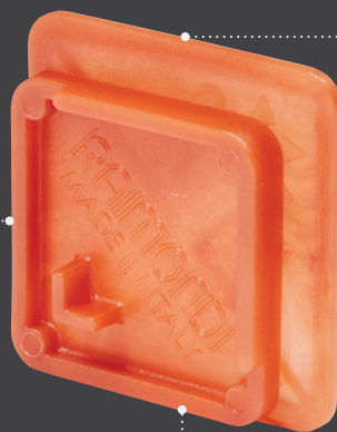
Vista frontale Front view Vue face Vista frontal

Un unico distanziatore, due misure (2 e 5 mm) One spacer, two joint sizes (2 & 5 mm | 3/32" & 3/16") Un croisillon, deux tailles de joint (2 et 5 mm) Un único separador, dos medidas (2 y 5 mm)